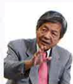
田原総一郎氏 ジャーナリスト

政治から経済、世界情勢、社会問題まで、あらゆる旬の話題を鋭く斬り込みます。問題の本質を突きながら、これからの時代について熟く語ります。