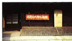
河井寛次郎記念館 http://www.kanjiro.jp/

国の登録有形文化財に指定されている京町家で京都の暮らしの知恵を学ぶ他、東山山麓の清水寺で秋の景色をご堪能いただいた後は、「暮しが仕事 仕事は暮し」の言葉を残した陶工・河井寛次郎の住まい兼仕事場にも立ち寄りという、京都ならではの旅程となっております。