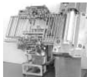
プリント配線基板の浸式レジスト塗布装置「斜めコーター」

液晶や半導体など最先端分野における製造装置の部品加工、総合組立、総合電装などに幅広く取り組んでいる『サツマ通信工業』。創業当初、場所や設備、そして人材も不足している中で、お客様から受注した仕事をやり遂げること