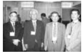
京情協の参加メンバー（写真右から）古川事業推進委員長、植田会長、白石名誉会長、駒井事務局長