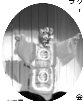
名古屋雅楽会による舞楽

「管弦・舞楽」と格調高いもので、飲酒して見聞きするものではなく、本来は神殿でお神楽奉納として奏上されるもので、居を正して見聞した。ステージが狭く舞手も大変だったようである。何にしてもこれらを写真やビデオに収めることができたのは、この会場なればこそである。