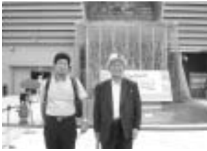
愛知万博・日立館前にて

10日は京都を出る時には雨の予報であったが、日頃の行い良く曇りの中、午前8時にバスに分乗して出発、いよいよ万博・長久手会場へと向かった。観光バスの駐車場から会場・西ゲートまではそこそこ歩き、辿りついたら入場するのに先ず最初の並びが始まった。一人ひとりカバンを開き、中身を確認の後、空港のゲートと同じセンサーチェック手続で、ブザーが鳴れば更にチェックとなる。午前9時の開門までに到着しても会場に入るのに30分はかかる。企業パビリオンには予約なしではまず入れないとの前夜のアドバイスで、グローバルコモン（各国のパビリオンが集まったエリア）の1つから入館した。並ばずに入れるのはこれらのパビリオン。