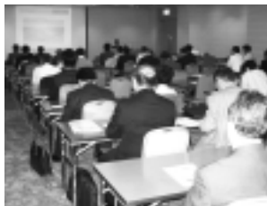
具体事例を交えた興味深い内容

オープン技術セミナーは、「ソフトウェアの特許を考える」を開催しました。第1部は、ジャストシステムのソフトウェア特許侵害報道などタイムリーな話題を含めたソフトウェア特許侵害(する側・される側)についての貴重な講演内容でした。また、第2部ではソフトウェア特許の歴史・特許対象・申請方法や特許取得費用を含めた詳細な内容を公聴することができ、ソフトウェア産業に携わる者にとって、大変参考になるセミナーでした。