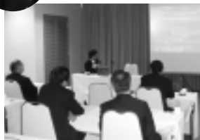
日中協働について熱心に聞く参加者