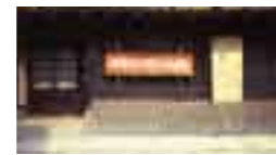
河井寛次郎記念館 http://www.kanjiro.jp/

国の登録有形文化財に指定されている京町家で京都の暮らしの知恵を学ぶ他、東山山麓の清水寺で秋の景色をご堪能いただいた後は、「暮しが仕事 仕事が暮し」の言葉を残した陶工・河井寛次郎の住まい兼仕事場にも立ち寄りという、京都ならではの旅程となっております。