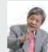
田原総一郎氏 ジャーナリスト

政治から経済、世界情勢、社会問題まで、あらゆる旬の話題を鋭く斬り込みます。問題の本質を突きながら、これからの時代について熱く語ります。